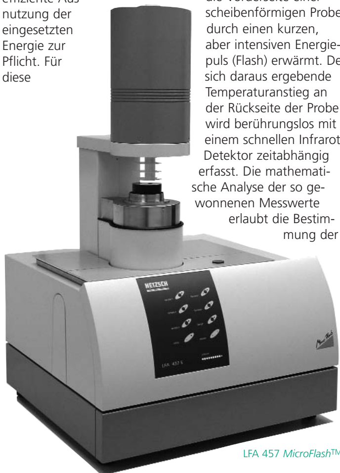
LFA 457 MicroFlash ™

Die Umwelt schonen heißt auch Energie sparen. Diese Thematik wird immer stärker zukünftige technische Neuerungen beeinflussen. In allen Bereichen unseres täglichen Lebens wird die möglichst effiziente Ausnutzung der eingesetzten Energie zur Pflicht. Für diese