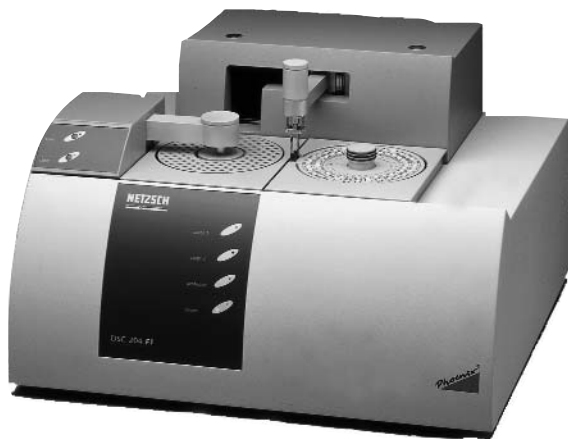
Abb. 1. DSC 204 F1 Phoenix®

Ein präzises, hochleistungsfähiges Wärmestrom-Kalorimeter galt bislang als unvereinbar mit einem robusten und flexiblen „Arbeits-tier“ für den rauen Industri-alltag. Mit der neuen DSC 204 F1 Phoenix®, der Formel 1 unter den DSC-Systemen, ist NETZSCH-Gerätebau dieser Spagat gelungen.