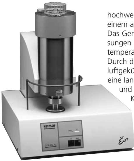
Abb. 1. Die neue DTA 404 PC Eos®

Die Differential-Thermoanalyse ist eine seit Jahrzehnten etablierte Methode zur Charakterisierung von Phasenumwandlungen und Zersetzungsreaktionen. Mit der neuen DTA 404 PC Eos® bietet die NETZSCH-Gerätebau GmbH ein qualitativ